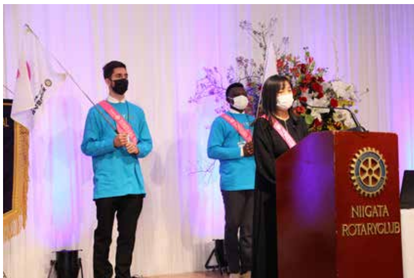
地区大会で活動報告