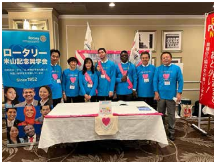
地区大会寄付受付