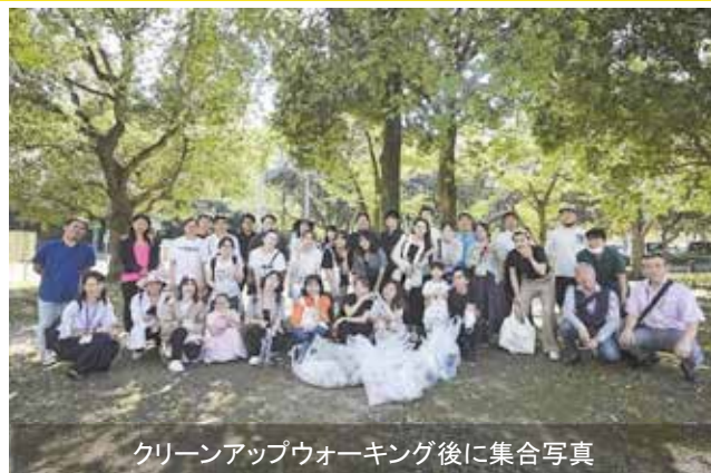
クリーンアップウォーキング後に集合写真

での約2kmを歩きながら、落ちているゴミを拾う「クリーンアップウォーキング」を行いました。この奉仕活動は今回が通算4回目となり、同地区内の浦和、与野、大宮、岩槻エリアにて活動。今後は上尾や戸田まで範囲を広げていく予定です。